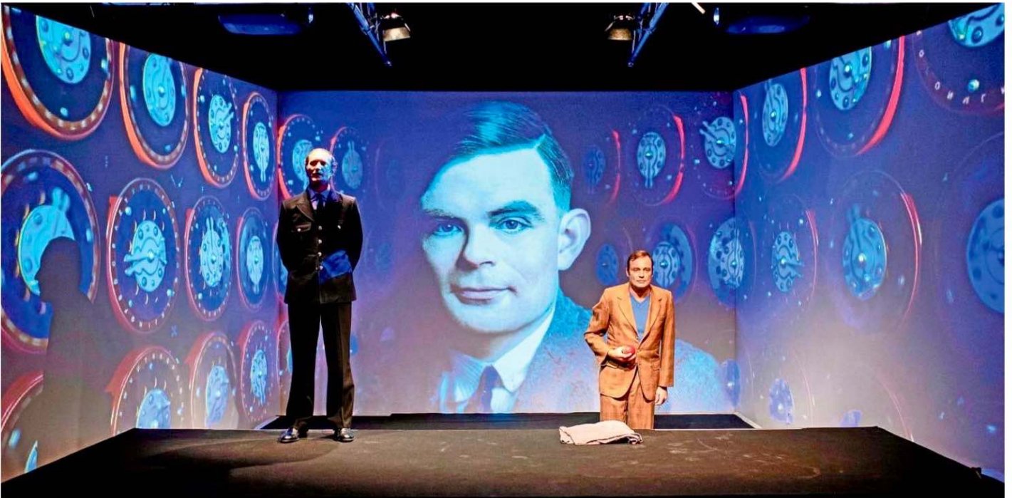
Der britische Mathematiker Alan Turing (hinten) wird im Stück von Axel Holst (r.) verkörpert. Raphael Dwinger spielt gleich mehrere Rollen.